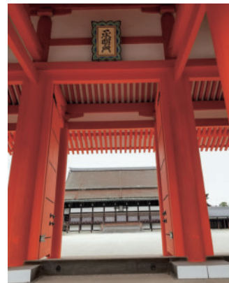
『源氏物語』の舞台となった京都御所