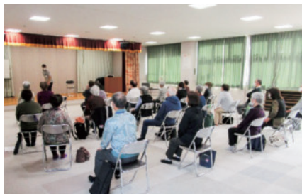
理学療法士による講話・運動指導