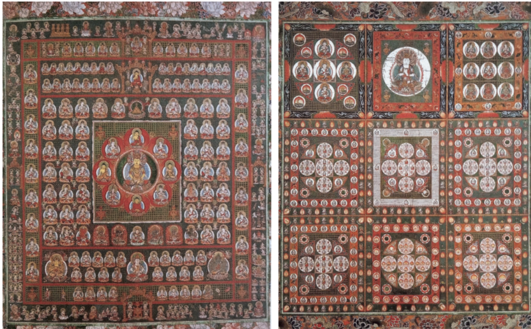
図1 胎藏界曼荼羅（左）と金剛界曼荼羅（右）