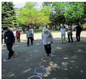
山鼻公園での認知症予防を兼ねた運動