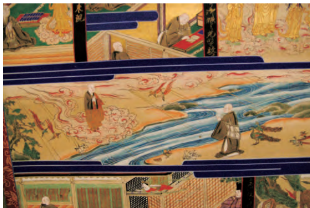
善導大師と法然上人のお出会い（当山蔵 法然上人絵伝 部分）