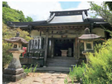
山奥の静かなお寺（医王寺）

北海道でもいままでの経験を活かし、皆様と一緒に手を合わせる事ができる幸せを感じながら活動していきたいと考えておりますので、どうぞよろしくお願いたします。