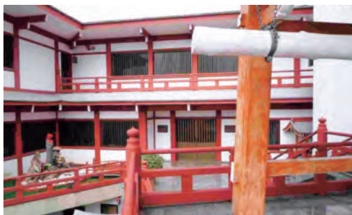
ブラジルの日伯寺