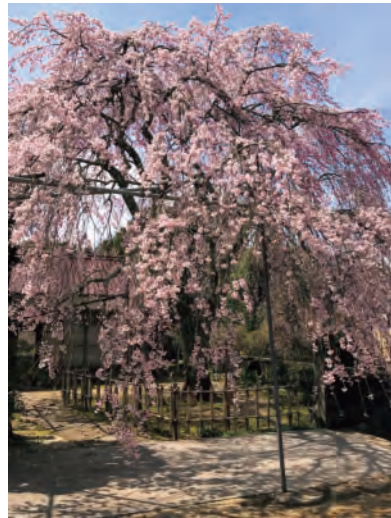
しだれ桜が有名（医王寺）