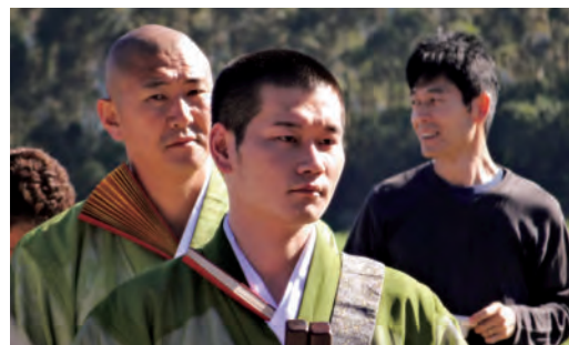
ブラジルでの法要の一幕