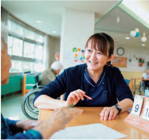
言語聴覚士による言語訓練