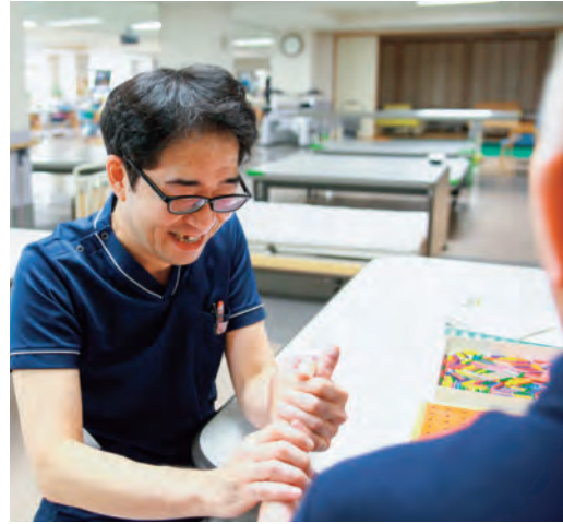
作業療法士による手指の訓練