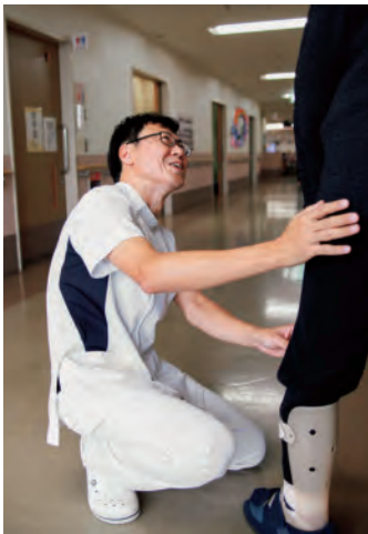
理学療法士による歩行訓練