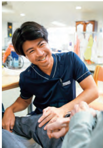
理学療法士による関節可動域訓練