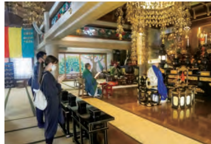
お盆と秋彼岸法要の様子です