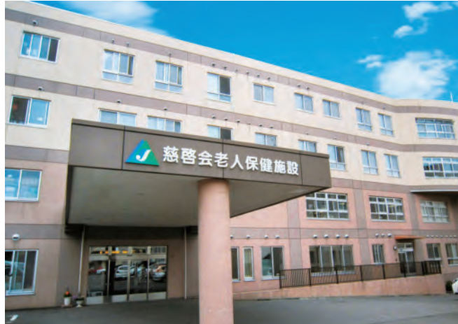
慈啓会老人保健施設 全景

「老人保健施設」は、長期入院をしていた方が、退院して家庭に戻るまでの間利用したり、在宅生活を送る中で、低下してきた身体機能のリハビリを集中的に行うために利用したりする在宅復帰を目指す介護保険が適用される公的な施設です。特別養護老人ホームと異なる点は、①終の棲家ではなく、入所期間は、基本的に3～6か月程度です。②要介護1～5の方が入所できます（特養は要介護3～5）。③24時間看護師が常駐しているため痰吸引等の医療ケアが必要な方の受け入れが可能です。