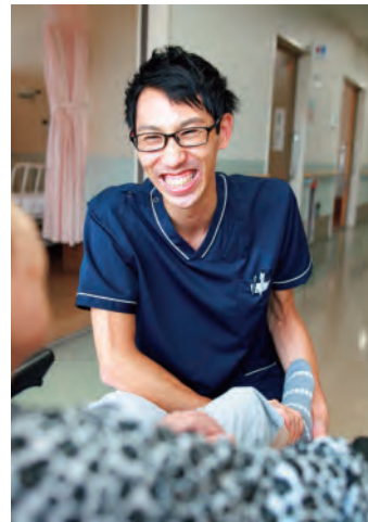
訓練中の会話がなによりの楽しみ

写真は理学療法士・作業療法士・言語聴覚士による訓練場面ですが、現在はコロナ感染予防のためマスクを着用して居室やフロアで施術しています