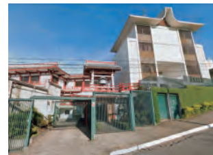
サンパウロ日伯寺

さて、ブラジルといいますとリオデジャネイロにある有名な巨大なキリスト像で分かるようにキリスト教の信仰が篤い国です。また、日本と違い「檀家制度」という考えが馴染んでいないので日本と違うところがあります。例えば私が葬儀に呼ばれ、会場に到着したときこれからお葬式を挙げる故人に神父様がお祈りを捧げていました。故人の息子様に後から伺ったところ「亡くなったお父さんは仏教の信者だからお坊さんと呼んだ、しかし私はキリスト教を信じるから神父さんと呼んだ」とのこと、また他のブラジルに小さい時来た日本出身のお爺さんは「日本の宗教だから神道は大事だ、ご先祖様の宗教だから仏教は大事だ、今住んでいる国の宗教だからキリスト教は大事だ」と仰っていました。日本と違い宗教は個人単位のものであると捉え、自分の宗教を大切にすると同時に他者の宗教も尊重する。考えが違う人を排除することは確かに楽かもしれませんが、しかしながらブラジルの様な移民の国だからこそ、信仰する宗教・文化が違ってても尊重しあえる、その姿に見習うべき点は多いかと思えます。