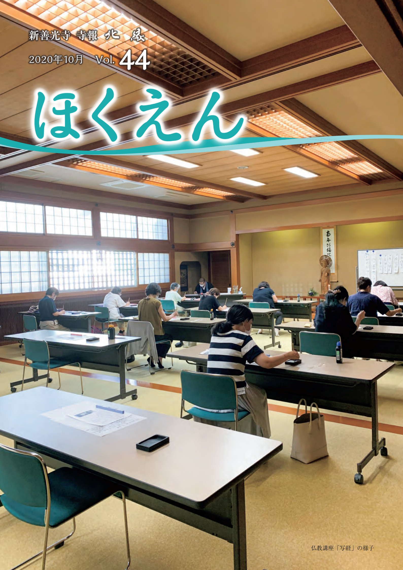
仏教講座「写経」の様子