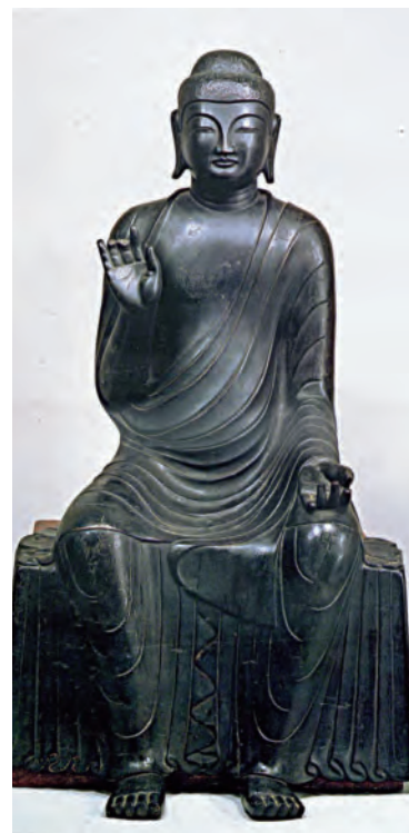
深大寺の釈迦如来倚像