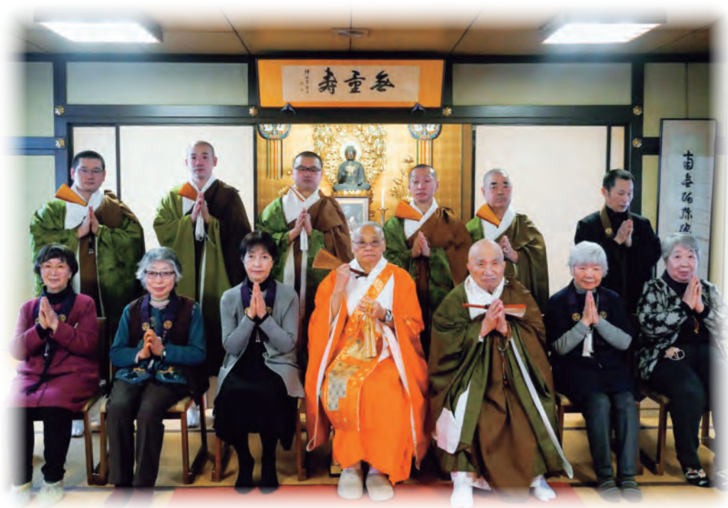
婦人会の方々との集合写真（法然上人御忌日法要において）