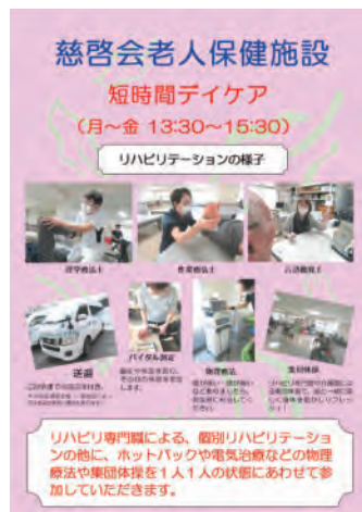
短時間デイケアのパンフレット

さらに、新たな取り組みとして、各事業所のケアマネジャーから問合があった「短時間リハビリ」を始めました。午後の13:30から開始で、当初は火曜日・水曜日・木曜日の3日間限定でしたが要望が多く、現在は月曜日から金曜日の午後で対応させて頂いております。体験利用も随時受け付けておりますので、興味のある方はお気軽にお問い合わせください。