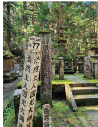
奥の院に建つ法然上人の供養塔