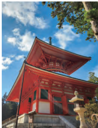
金剛峯寺根本大塔