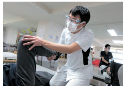
理学療法士の訓練様子