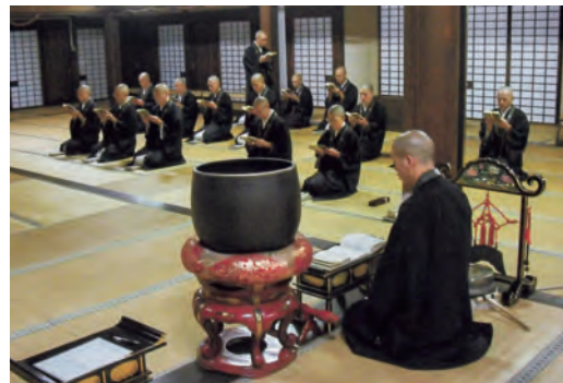
大殿の中で読経中の学生