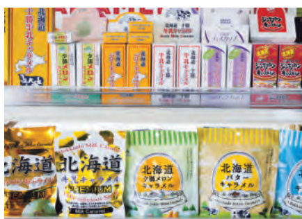
沢山の商品があります