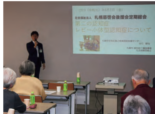
— 昨年の定期総会の様子