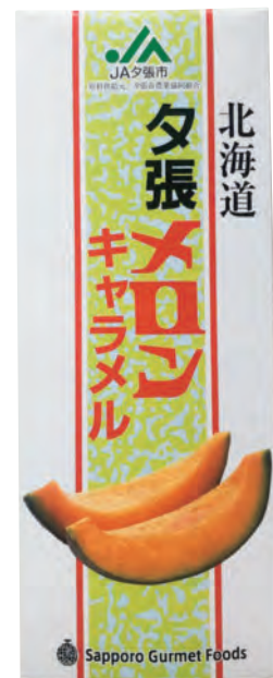
夕張メロンキャラメル

その4日後に部長から連絡が来て「私だけ反対したけど、あとの皆さんは良いって言うから。許可出しますよ。」と言われました。いやあ、その日のビールは格別に美味しかったですよ。」と当時の事を思い出され笑顔でお話されま