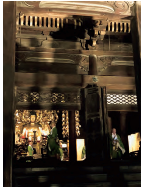
阿弥陀堂での法要の様子

また、この中段の少し行った所には1678年に作られました鐘楼もあり、高さ3.3メートル、重さ70トンの巨大な鐘は僧侶17人で突きます。除夜の鐘はテレビ等で中継放映されるのでご覧になられたことのある方も多いのではないのでしょうか。