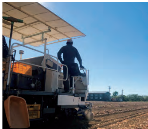
取材した日は快晴で、見渡す限りの青空