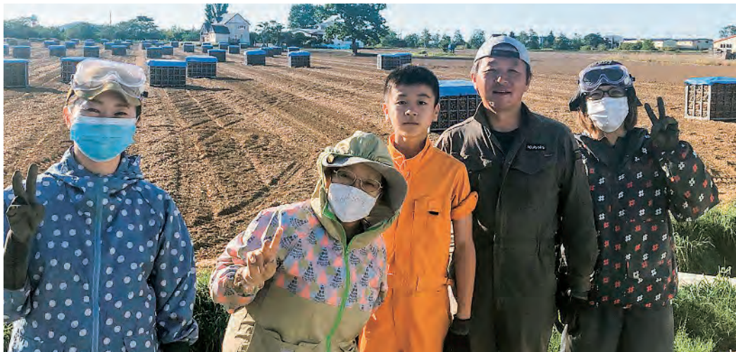
皆さん笑顔で仲の良さが伝わります