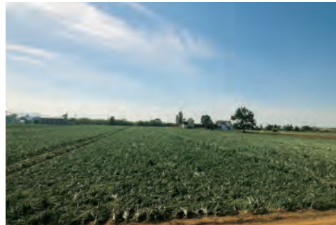
8月の畑は一面、緑でした

玉ねぎの種類は主にF1種の“北もみじ2000”、そして少量ですが“さつおう”と“札幌黄”を栽培されています。“さつおう”は札幌黄の品種改良された玉ねぎで格別に美味しいということで、学校給食で使われているようです。