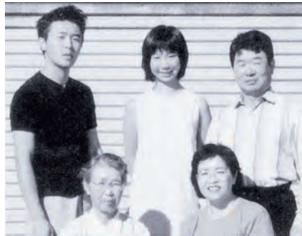
平成10年発行の北札幌農業協同組合史の組合員紹介ページより