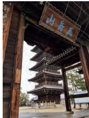
四国八十八箇所 第七十五番善通寺五重塔