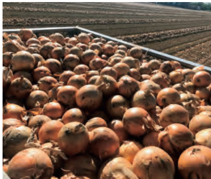
コンテナにびっしりと入った玉ねぎ

息子さんの嗣元さんと妹さんお嫁さん、そしてお孫さんと3世代にわたって皆さんで協力して収穫作業しております。お孫さんは機