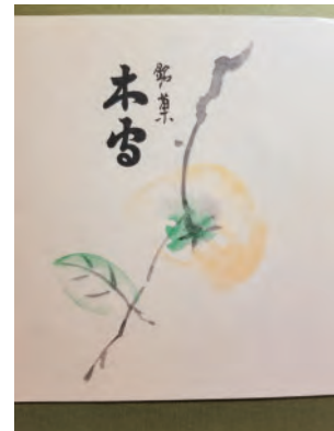
銘菓 木守の掛け紙