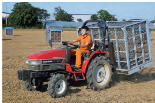
スイスイと運転されていたお孫さん