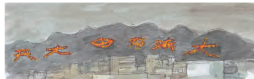
京都市街地より五山送り火を望む