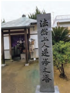
善通寺境内にある法然上人の御遺跡

無意味という意味を重んじ、無価値という価値を尊んできた我が国の祖先が培ってきた精神をこれからも大切にしたいものです。近頃は、そんな寛容で曖昧な我が国独特の精神が、薄れてきたように感じます。讃州の旅は、我が国の文化のかぐわしい香りを思い出させてくれました。 〈文：立花 俊輔〉