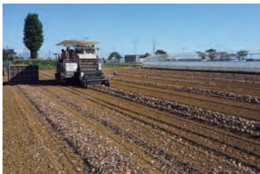
後方座席には妹さんとお嫁さんが座られて作業